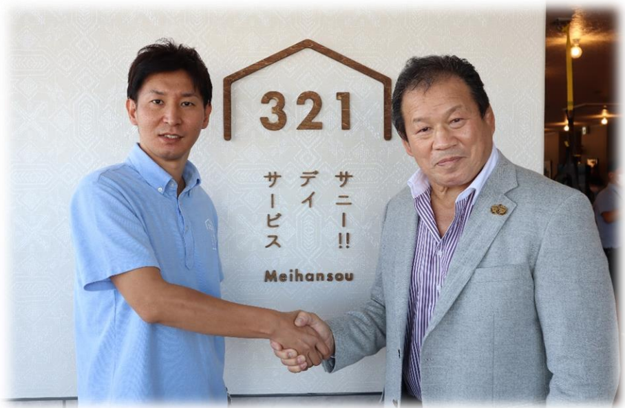
藤波辰爾選手 来所！！