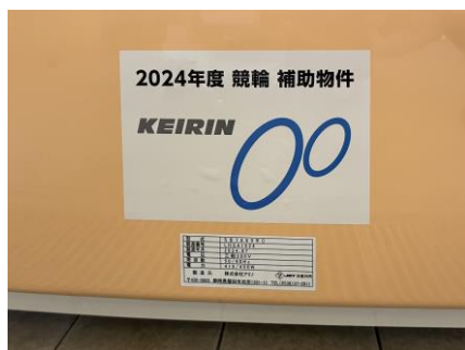
マリンコートリモ (SB7000RC)