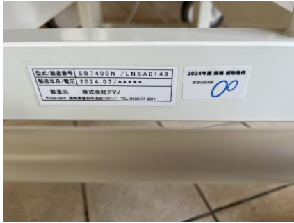
コンパクトストレッチャー (SB7400)